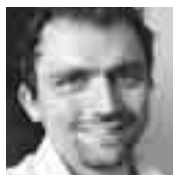
Του Γιάννη Ζαμπετάκη

Με απλά και σταράτα λόγια, δεν ξέρουμε τι πουλάνε, πόσο το πουλάνε και σε ...ποιον το πουλάνε. Στο γάλα, τα δύο μόνο στοιχεία που ξέρουμε είναι τα εξής: τιμή παραγωγού (0,30 ευρώ) και τιμή στο ράφι του σούπερ μάρκετ (1,20-1,50 ευρώ) / λίτρο. Στο γάλα, τα πράγματα είναι απλά: μεταξύ παραγωγού και καταναλωτή υπάρχουν μόνο δύο... μεσάζοντες. Η γαλακτοβιομηχανία και το σούπερ μάρκετ. Σε τι τιμή πουλά το παστεριωμέ-